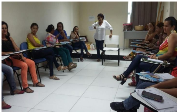
Formações do Baú de Leitura – concepção de leitura lúdica

Buscando ampliar as ações do Projeto Baú de Leitura e expandir mais a quantidade de crianças leitoras, foram realizadas ações nos municípios para incentivar e divulgar o projeto, a exemplo as mostras de artes a partir dos livros do acervo do Baú, intercâmbios e passeios. Como resultado, é perceptível a melhoria da leitura e da escrita nas crianças.