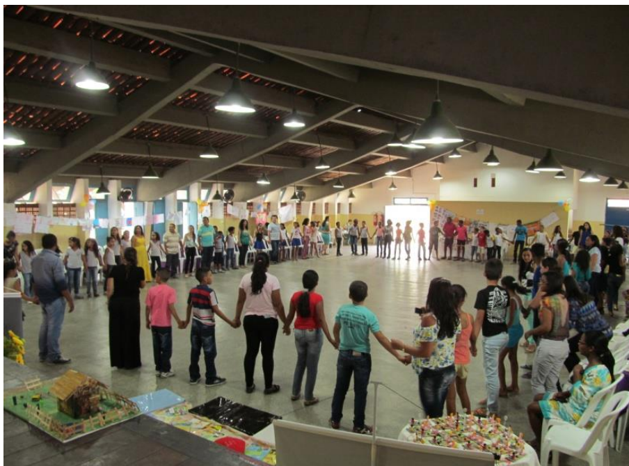
Crianças, adolescentes, Professoras/es, Coordenadoras/es e sociedade Civil em ação de Arte e Educação