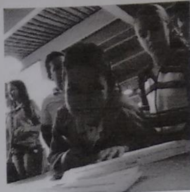
As crianças do projeto Parceiros/as Por Um Sertão Justo são atendidas no sistema de vínculos solidários que formam um elo de ligação entre elas e doadores que residem no Brasil e Grécia

é um movimento global de pessoas que trabalham juntas para promover os direitos humanos e superar a pobreza. É uma organização sem fins lucrativos, com sede na Inglaterra e escritório no Brasil. A ActionAidBrasil iniciou suas atividades em 1999, definindo como áreas prioritárias de trabalho o nordeste rural e as grandes regiões metropolitanas do sudeste. Com base numa estratégia nacional, a entidade busca identificar como parceiros os movimentos sociais e ONGs atuantes com projetos de desenvolvimento local nas áreas de maior pobreza e desigualdade social.